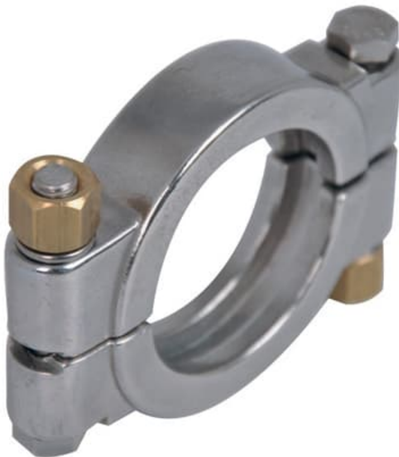
Morsetto CLAMP ALTA PRESSIONE Materiale: AISI 304 (1.4301)