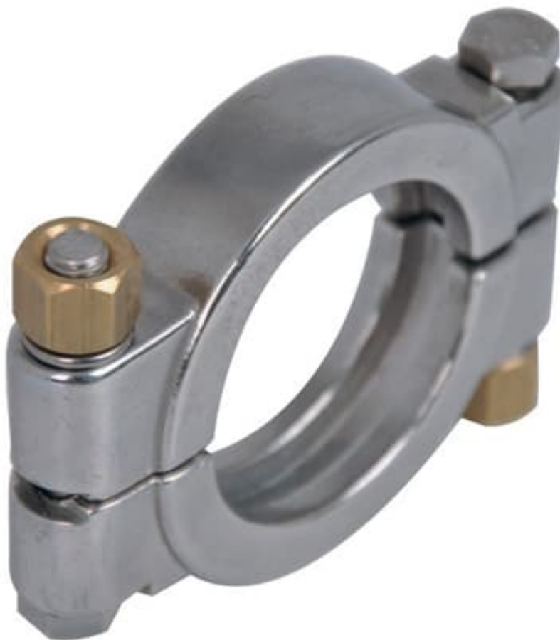
Abrazadera CLAMP ALTA PRESIÓN Material: AISI 304 (1.4301)